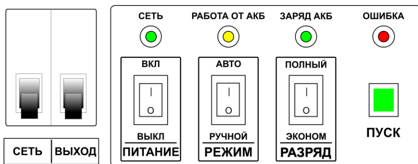
Рисунок 1. Панель управления и индикации

Устройство выполнено в защитном корпусе. На лицевой панели размещены: